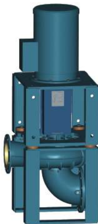
ALLMARINE® - MI (исполнение “in-line”)

Оба модельных ряда поставляются с цокольными и стеновыми креплениями.