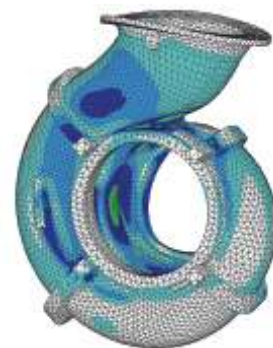
Анализ испытываемых нагрузок ALLMARINE® MA 350-315

Помимо низкого уровня шума результатами оптимизации являются более низкие внешние нагрузки на насос и соединения труб, а соответственно, более продолжительный период эксплуатации и более низкие эксплуатационные расходы.